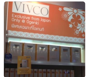
VIVCOシリーズの売場 (OGENKI店内)