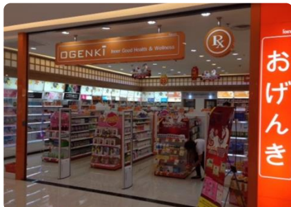
タイ国内に現在9店舗 BJCが展開する『OGENKI』