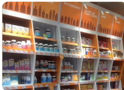
取扱商品はヘルス&ビューティ商品 が中心(OGENKI店内)