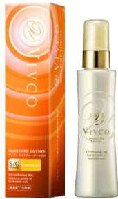
VIVCO モイスチャーローション 120ml