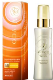
VIVCO モイスチャーエマルジョン 100ml